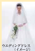
ウエディングドレス (イメージ)