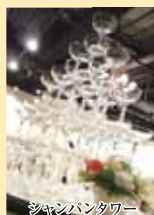
シャンパンタワー