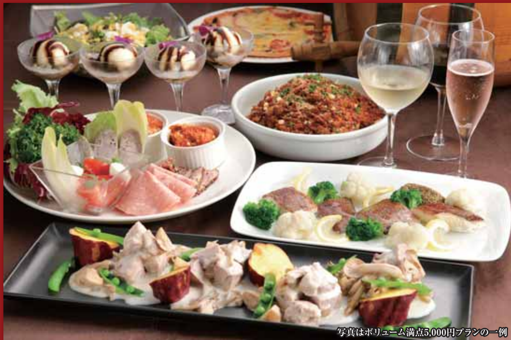
写真はボリューム満点5,000円プランの一例